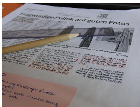
Unterlagen der Presseanalyse