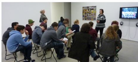
Workshop für Schüler und Schülerinnen