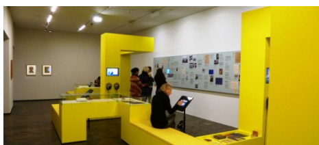
Arnold Schönberg Center