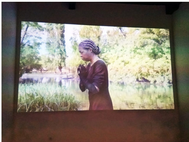
Eines der Rituale.

Jede der fünf Performerinnen nimmt sich nach und nach die Orte vor und führt magisch-anmutende Rituale durch, für die Ritualgegenstände zur Reinigung und Heilung der Plätze angefertigt wurden. Die Frauen versuchen mit Gesten, Tanz oder den Ritualgegenständen den Platz zu reinigen und zu heilen. Eine besonders einprägsame Gestik vollführte eine Performerin auf einer Bank, als sie eine „Wunde“ im Holz der Rückenlehne mit einem Klebeband verschloss.