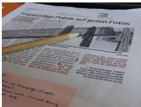
Unterlagen der Presseanalyse

haben, scheint zu überraschen, denn das Alter der Künstler und Künstlerinnen wurde mehrfach hervorgehoben. Gerade hier findet sich aber das große Potential von Kunst, den Menschen nicht nur einzuladen persönliche Lebenserfahrungen zu reflektieren, sondern diese auch in einen gesellschaftlichen Kontext zu setzen. Der Bereich der Ausstellungsforschung eröffnet an dieser Stelle viele anschauliche Möglichkeiten, um solche Prozesse sichtbar zu machen. Darin mag auch die große Qualität dieses jungen Forschungsfeldes liegen, denn wie ein Besucher hinsichtlich seiner Kunsterfahrung so schön formuliert, liegt der Reiz darin, „dass man sich auseinandersetzt mit dem Wirken des Menschen in der Welt“ (Forschungsbericht Manuela Seethaler und Günther Jäger).