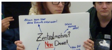
Workshop für Schüler und Schülerinnen